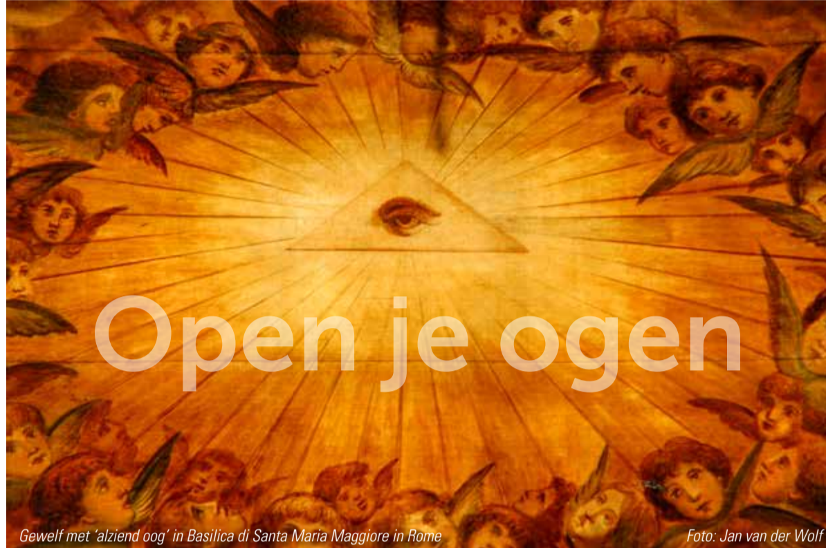
Gewelf met 'alziend oog' in Basilica di Santa Maria Maggiore in Rome

Ik vind dat helemaal niet zo'n prettig idee. Want dat betekent dat God alles van mij ziet, ook die gedachten en fantasieën die ik liever voor mijzelf houd. Die röntgen-blik van God is niet fijn.' Je kunt ook andere geluiden horen. Een oudere vrouw vertelde in een kring: 'Ik was een bijzonder kind en had het gevoel dat mijn ouders mij niet begrepen. Mijn moeder zei – met alle goede bedoelingen – tegen me: "Ga toch lekker buitenspelen met de andere kinderen." Terwijl ik liever met een vergrootglas een spinnenweb in de tuin bekeek. Mijn moeder vond dat maar raar.