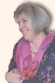
• Marieke (A.M.) van der Giessen-van Velzen HOOFD/EINDREDACTIE

Dat gaat ook op voor God leren kennen en lezen in de Bijbel. Je ogen opslaan, je ogen richten op wat je kunt leren. Zo je ogen opendoen geeft ervaringskennis en inzicht waar je met je hele bestaan bij betrokken raakt. Die kennis wordt om zo te zeggen geleerd op de school van de Heilige Geest. Dan hoeft straks niemand elkaar meer te onderwijzen over wie God is, zegt de profeet Jeremia in hoofdstuk 31: 'Want zij zullen mij allemaal kennen, van de kleinste af tot de grootste toe.'