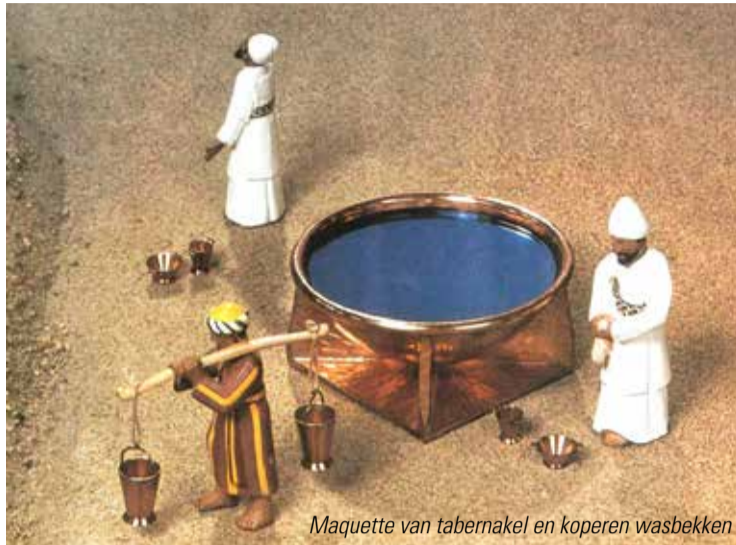
Maquette van tabernakel en koperen wasbekken

BESPIEGELING • In mijn vorige kerk, de Open Poort in Boskoop, hing in de hal een hele mooie spiegel. Deze was speciaal gemaakt voor de kerk toen deze honderd jaar bestond. Een kunstenaar had prachtige druivenranken erop geschilderd en ook de tekst uit 1 Korinthe 13:12: Nu zien we nog maar een afspiegeling, een raadselachtig beeld, maar straks staan we oog in oog. Nu is mijn kennen nog beperkt, maar straks zal ik volledig kennen, zoals ik gekend ben.